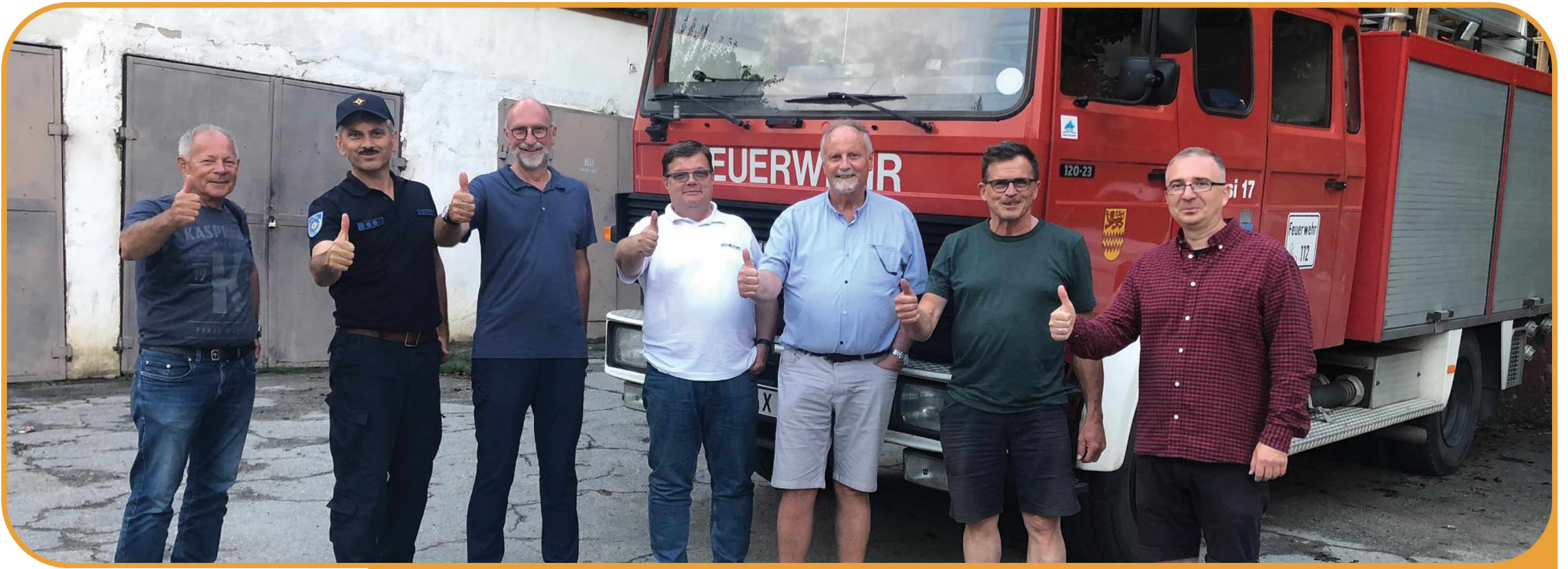
Kauf, Restauration und Übergabe eines Feuerwehrautos an Gemeinde in Moldawien