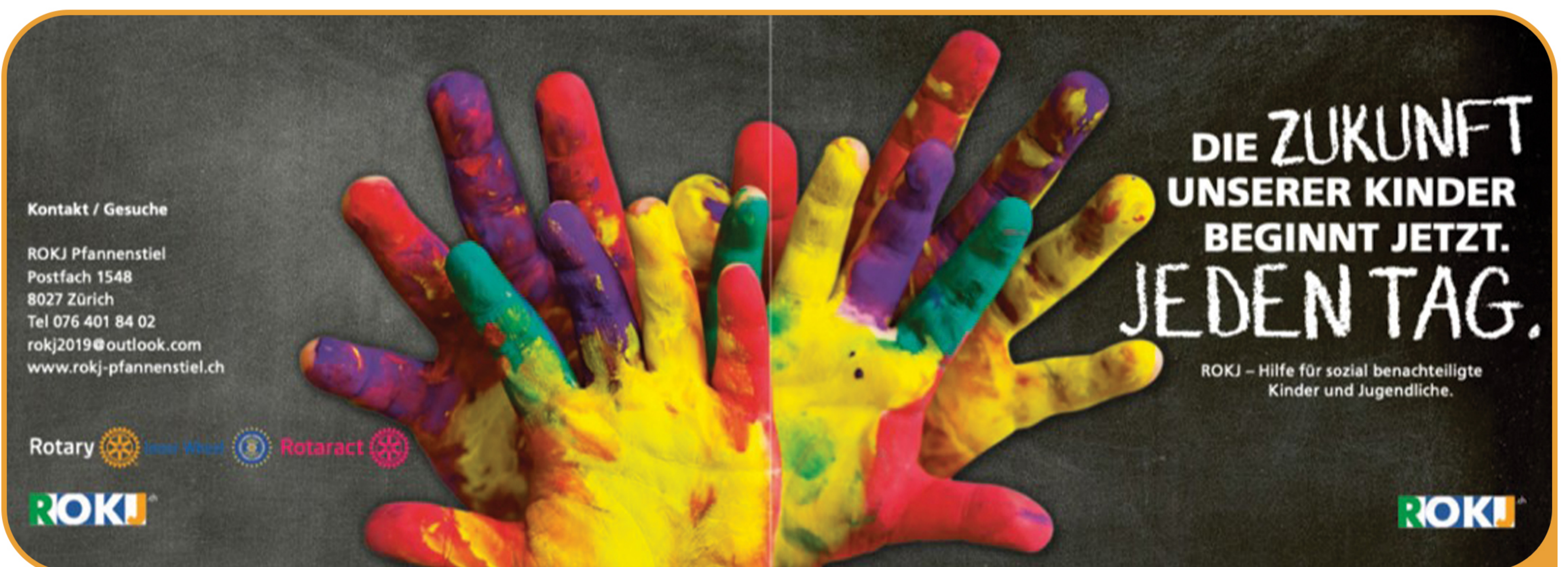
Parterschaft mit ROKJ.CH - https://rokj.ch