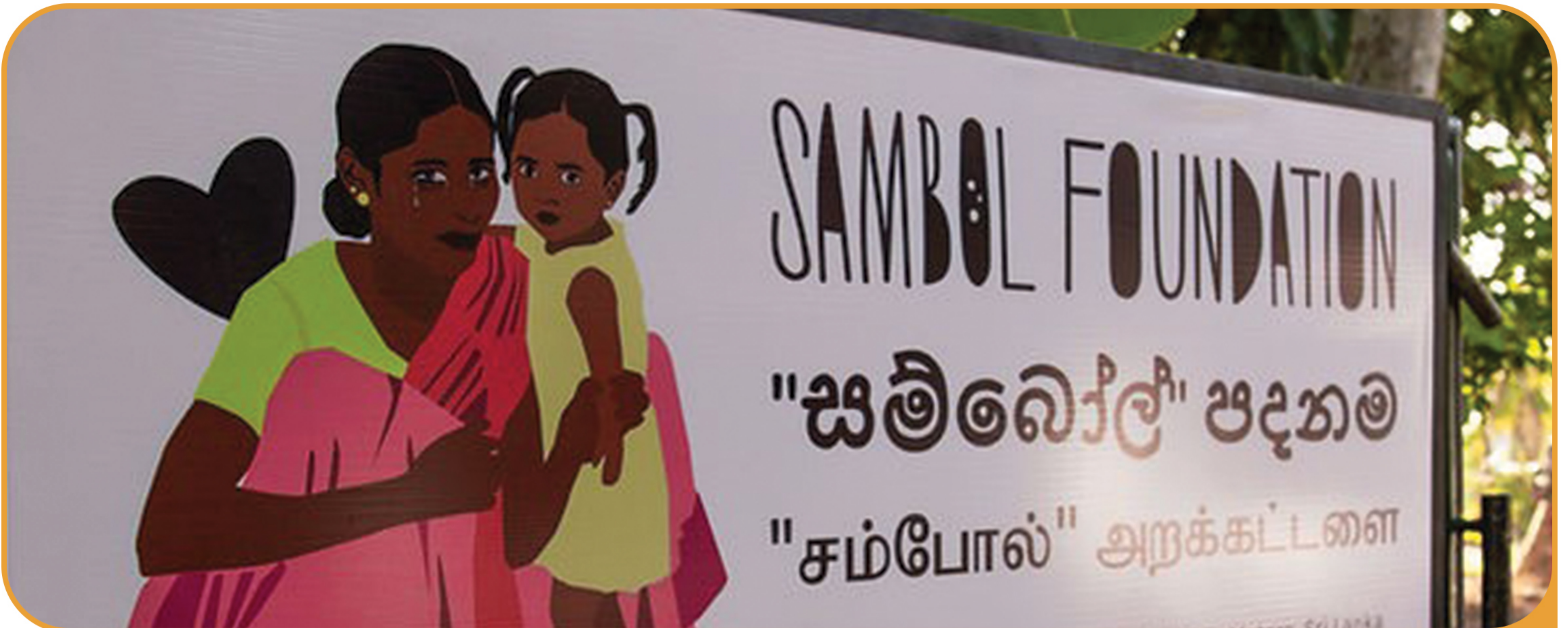
Unterstützung der Sambol Foundation in Sri Lanka - https://www.sambolfoundation.org