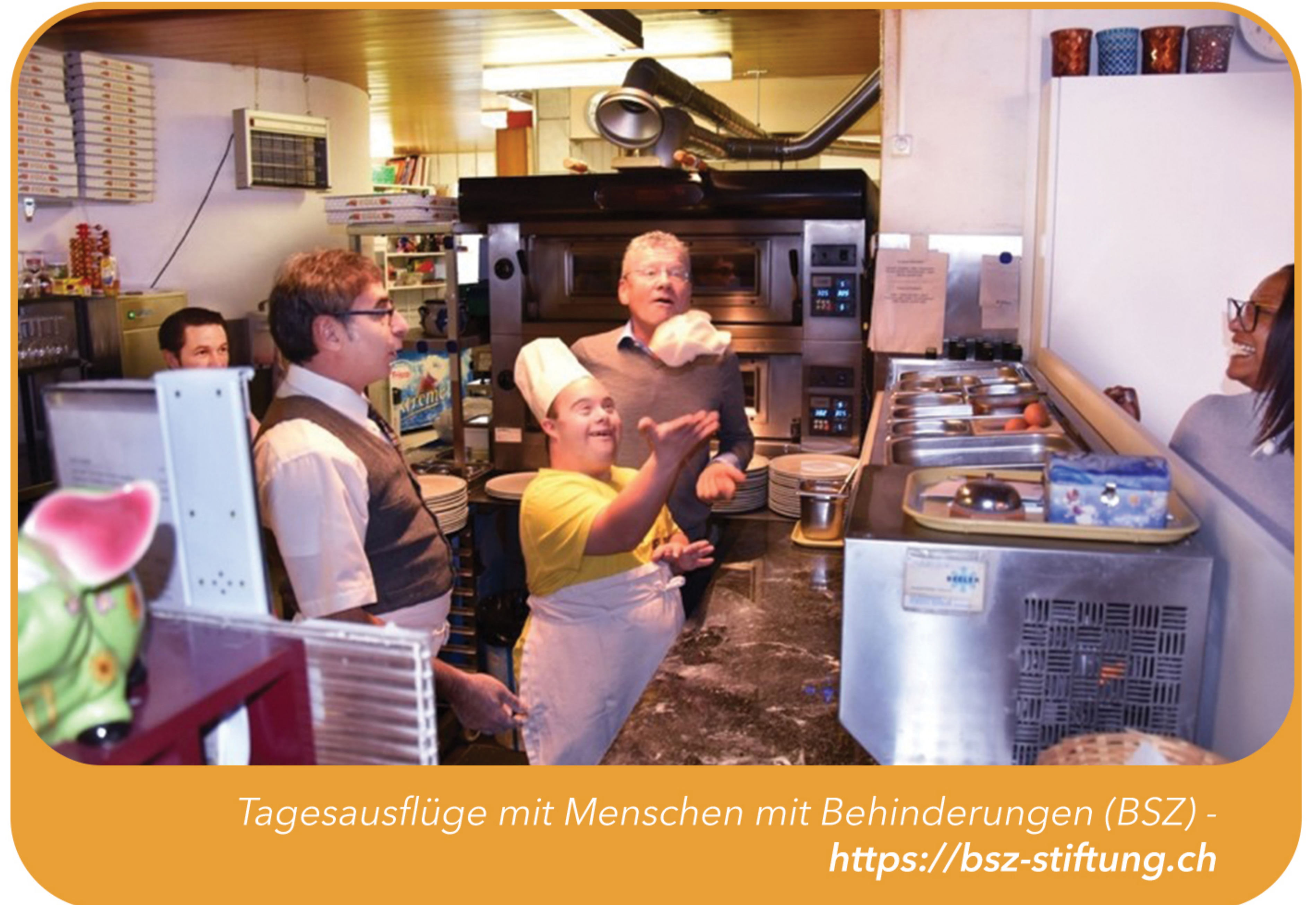
Tagesausflüge mit Menschen mit Behinderungen (BSZ) - https://bsz-stiftung.ch